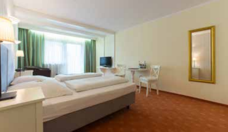
Geräumiges Doppelzimmer im Landgasthof Räucherhansl