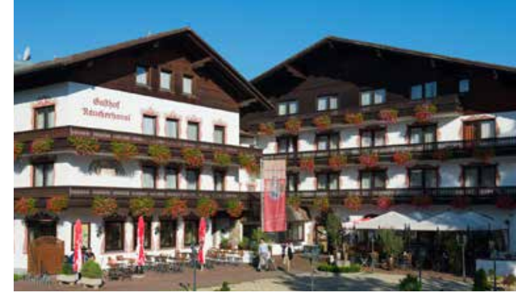
Landgasthof Räucherhansl in Oberteisbach, Niederbayern

Jeder Referent hat maximal fünf Schüler. Als Seminarteilnehmer erhältst Du zwischen Freitag und Sonntag vier Unterrichtseinheiten zu je 30 Minuten, in der Regel je 30 Minuten am Vormittag und 30 Minuten am Nachmittag.